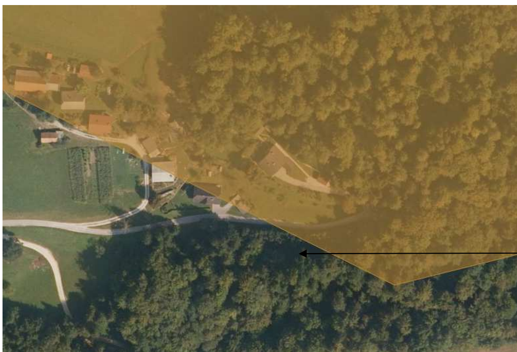
Slika 4: Podatki o prikazu stanja prostora

Ne nahaja se v območju veljavnih državnih prostorskih načrtov ali državnih prostorskih načrtov v pripravi.