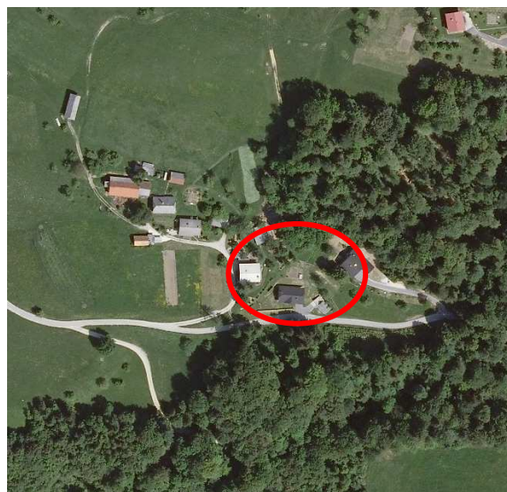
Slika 3: širši prikaz v prostoru – digitalni ortofoto posnetek