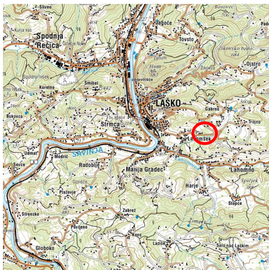
Slika 2: širši prikaz v prostoru – topografija