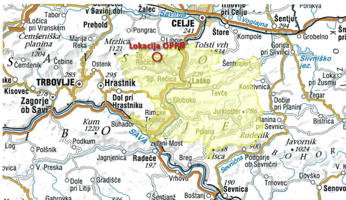
Slika 3: Območje občine Laško in lokacija območja OPPN

Vir: portal eTerra, www.etera.si , marec 2024