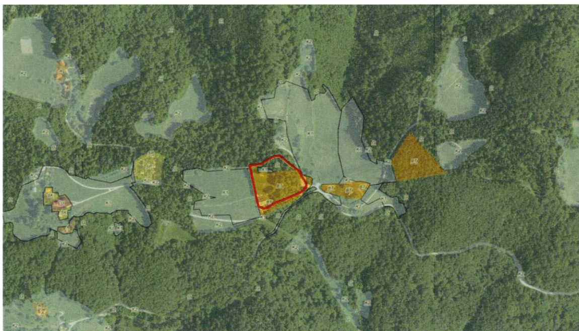
Slika 5: Prikaz obravnavanega območja OPPN in namenske rabe