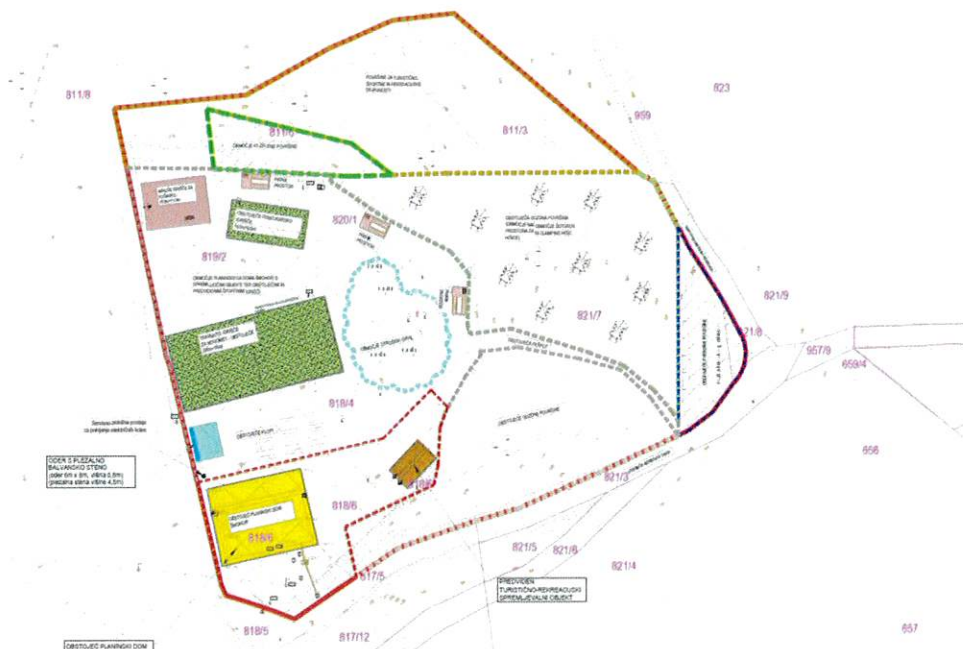
Slika 6: Ureditvena situacija