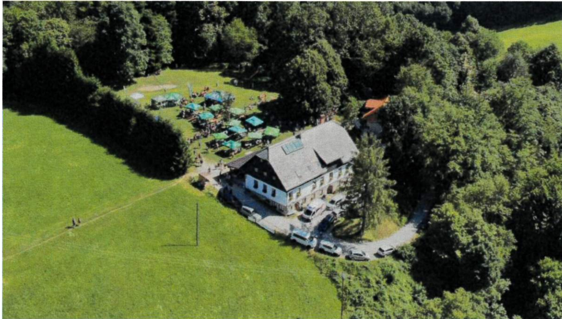
Slika 2: Obstoječe stanje obravnavanega območja

Vir: predlog Odloka o občinskem podrobnem prostorskem načrtu za enoto urejanja ŠO-1 »Ureditev turistično rekreacijskih površin pri Planinskem domu Šmohor« (ID 1738)