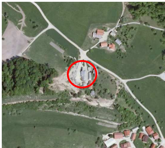
Slika 3: širši prikaz v prostoru – digitalni ortofoto posnetek (vir: www.geopedia.si )