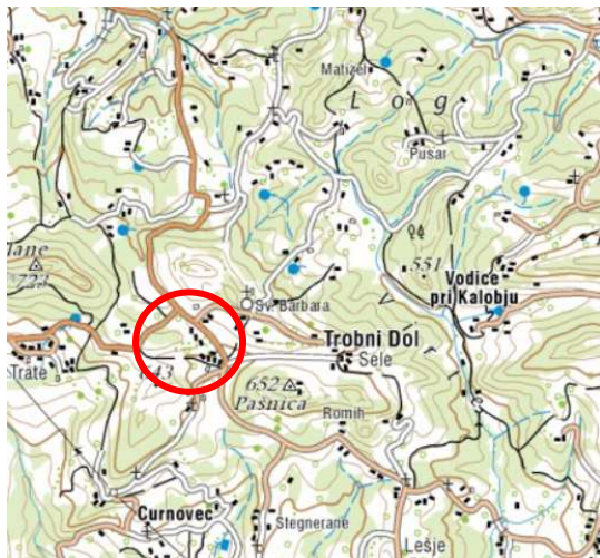
Slika 2: širši prikaz v prostoru – topografija