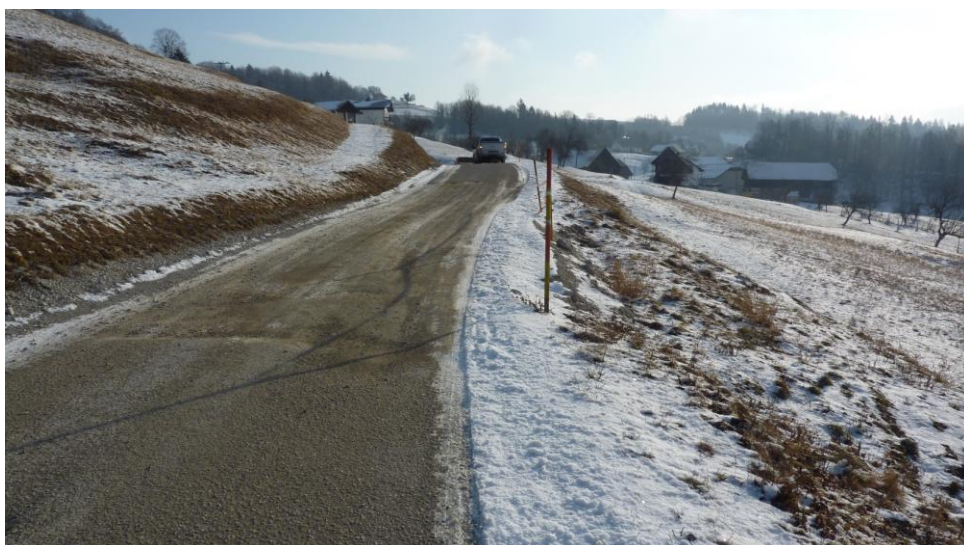
Slika 2: Pogled na lokacijo prvega usada »Trobni dol 2« v smeri Trobnega Dola